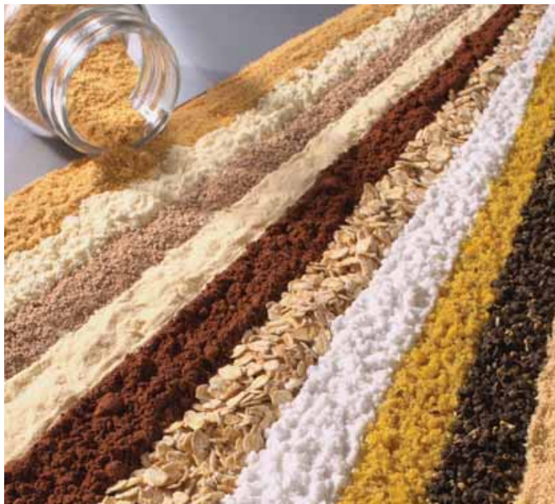
Produkte, die mit dem ORBIS abgefüllt werden können