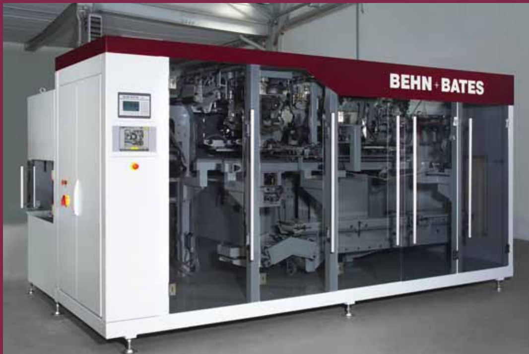
BEHN + BATES-TOPLINE - Der Vollautomat für die Abfüllung pulverförmiger Produkte in offene Säcke mit Füllgewichten von 10 bis 25 kg bei Leistungen von 200 bis 600 Sack pro Stunde

BEHN + BATES – Ihr zuverlässiger Partner, wenn es darum geht, Nahrungsmittel effizient und sauber zu verpacken.